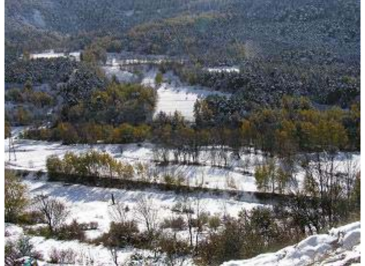
De la route du Bourget à Villarodin