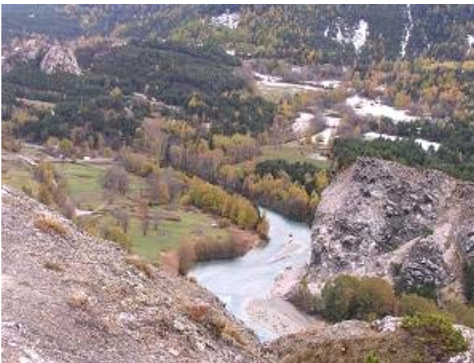
Du rocher des amoureux