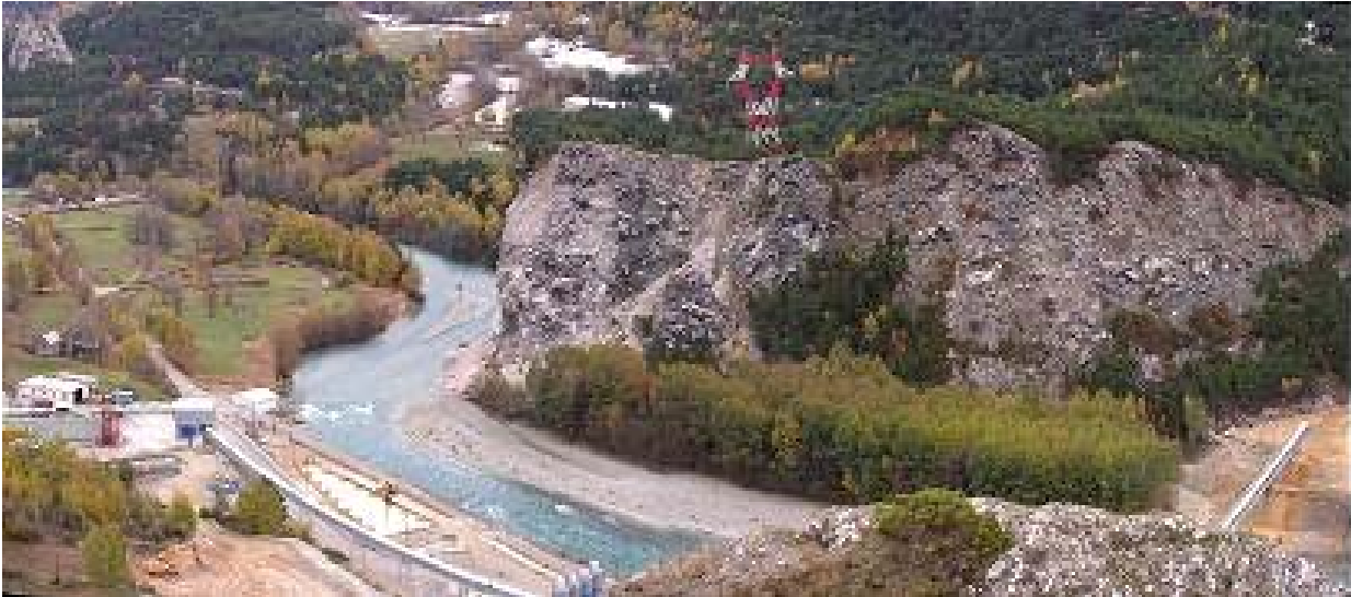
Du site des Tierces, il est dangereux de s'aventurer aux abords du rocher de gypse, le terrain est instable.