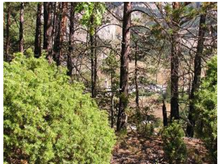
Dans la forêt, entre les pins on aperçoit le Bourget.