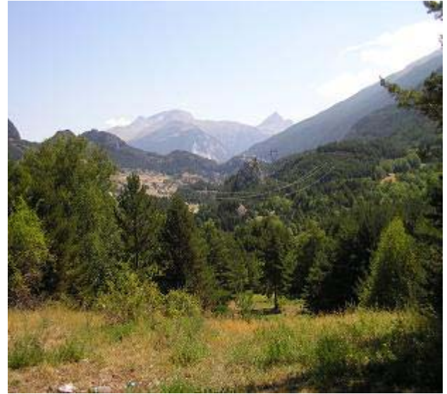
Sur le site