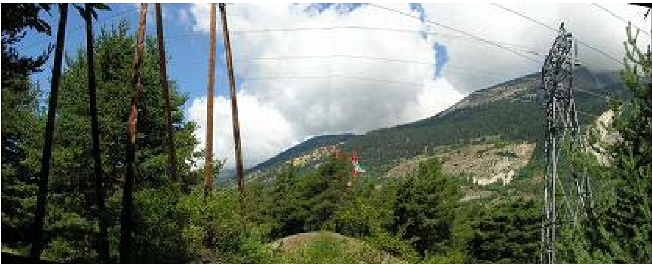
Un échantillon de lignes à plus ou moins haute tension traverse le site.