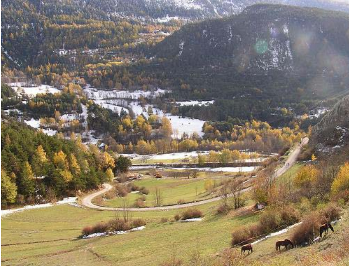
De la départementale

Point de vue sur le moulin et les Tierces