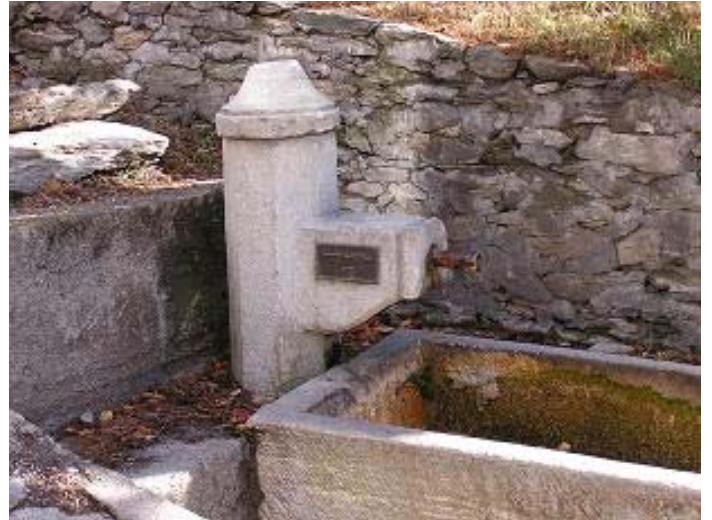
Les fontaines sont taries par les travaux de la galerie, l'eau s'écoule aujourd'hui directement dans l'Arc