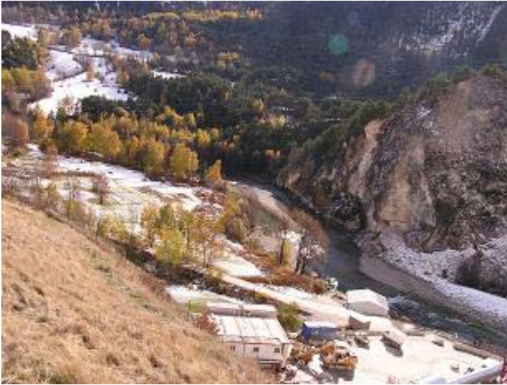
Le site est situé en rive gauche de l'Arc derrière le rocher de gypse.