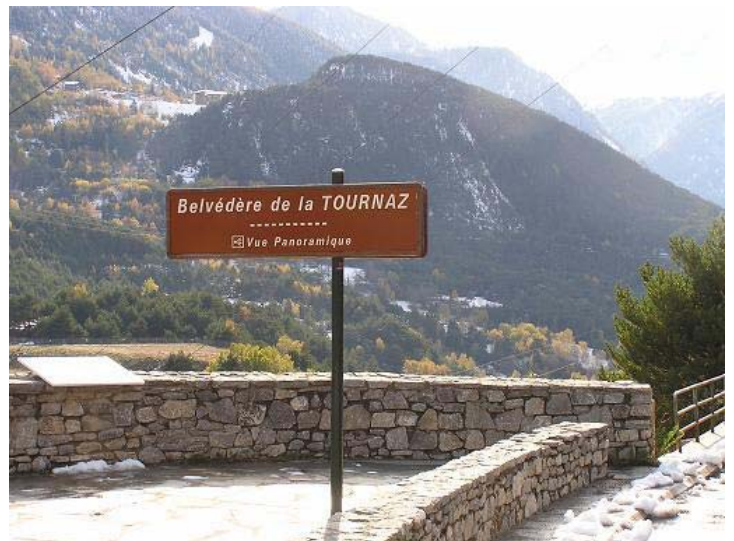
Du belvédère sur le futur chantier des Tierces.