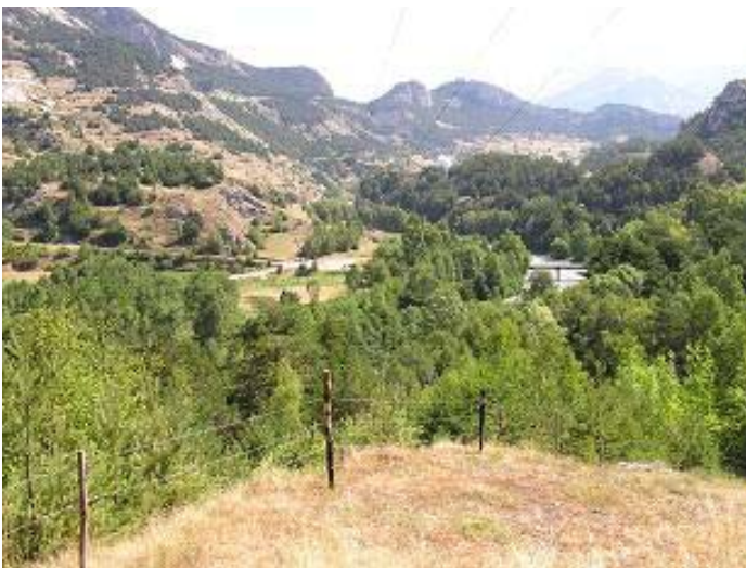
Point de vue du site, l'amont de la vallée.